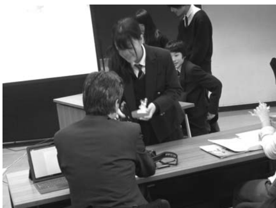
最終報告会の様子 (お土産サンプルを試食)