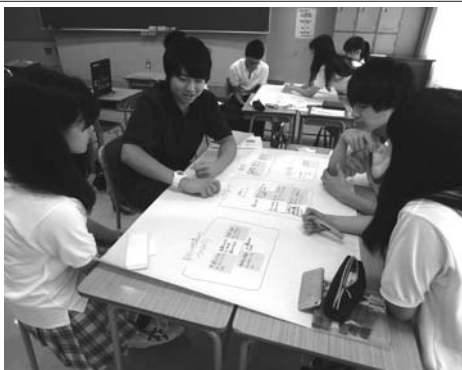
「幸せの価値観を考える」 授業の様子