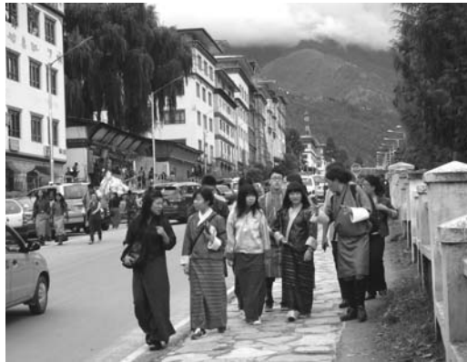
日本語学校の生徒たちと 街を散策

現地研修では、JICAの活動現場をはじめ、ブータンの社会問題にかかわる様々な現場を訪問し、現地の事情を体感する。青年海外協力隊や現地で働く方々の生の声に触れ、海外で働くことの面白さや難しさを感じることもできる。また、学校交流やホームステイなど現地の人々との交流を通して、ブータンの人々の考え方や生き方などの価値観についても直接感じることになる。